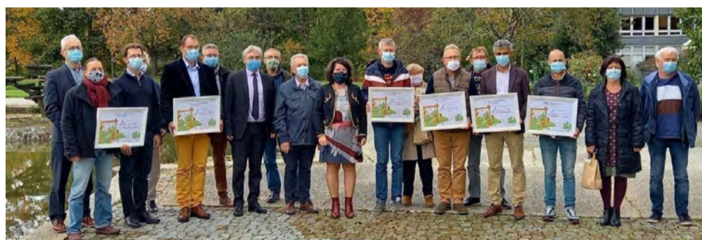
Les lauréats ont été récompensés vendredi 16 octobre à l'hôtel du département à Rennes.