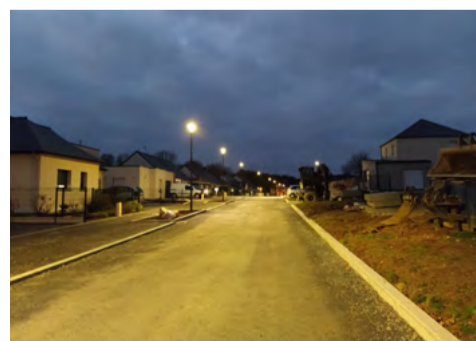
Travaux de voirie en cours d'achèvement

Pour toutes informations, veuillez contacter la mairie au 02 99 98 01 50.