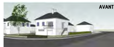
Esquisses architecturales d'un bien vacant en vue d'une mise en vente (Louvigné-du-Désert)

Pour les projets portant sur des logements locatifs ou l'accession d'un logement vacant, les personnes intéressées devront se rapprocher du service Habitat de Fougères Agglomération auprès de Maud Le Hervet, coordinatrice de l'opération (02 99 98 59 46).