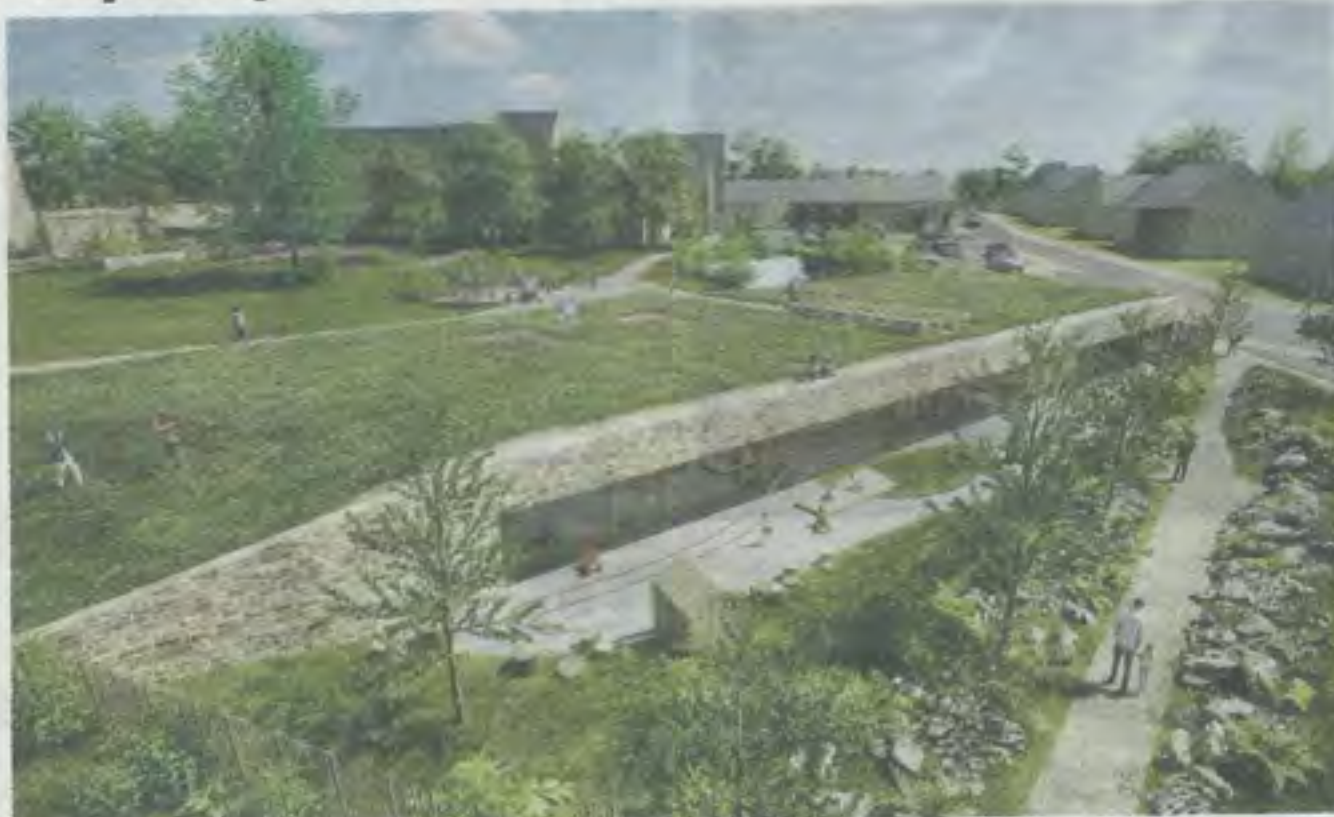
Le bâtiment, écologique, va se fondre dans le paysage Atelier Rubin et associés, Lannion

Les habitants du Louvigné qui craignaient de voir amputer le parc de la communauté et les riverains inquiets devraient être rassurés. Le futur pôle petite enfance ne va pas dénaturer le site ni supprimer les espaces verts. C'est en effet un projet original et écologique qu'a présenté l'Atelier Rubin et associés de Lannion, choisi par le conseil municipal de Louvigné-du-Désert. Un jury de concours avait précédemment permis de retenir trois cabinets de maîtrise d'œuvre sur 37 propositions, chacun des trois devant présenter une esquisse.