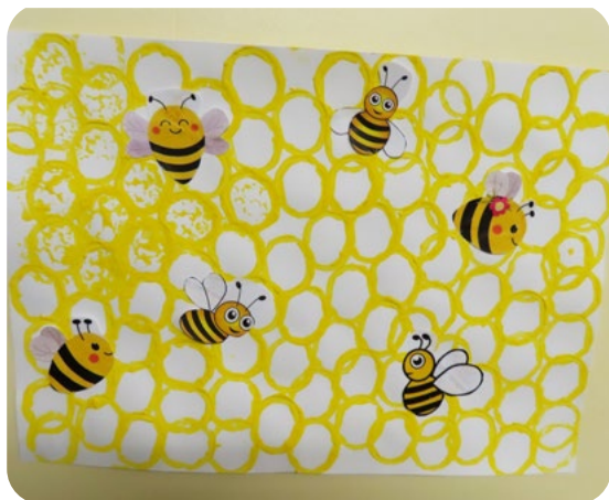
Modèle réalisé par un adulte